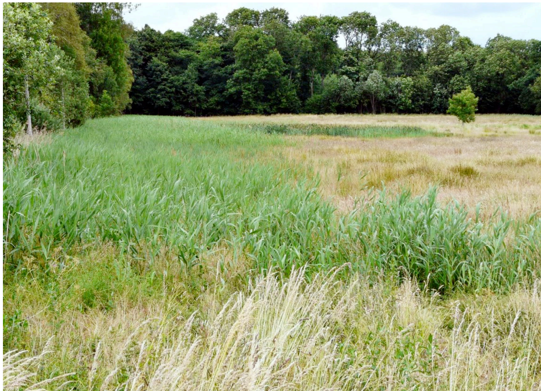
8a. Markblok: 598134-28 Odense kommune

Det kan ikke afgøres, om det er tvungen eller frivillig brak, der er lagt på §3 arealet. Da man ifølge Landbrugsstøttekontoret ikke ved, hvor den frivillige brak er liggende hos den pågældende ansøger.