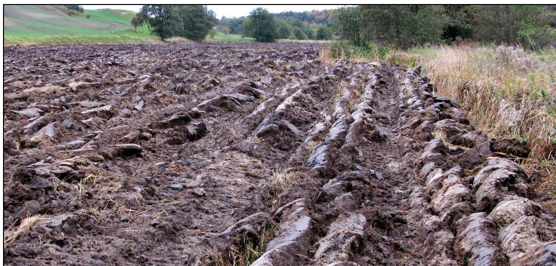
A målsat §3 eng opløjet 2 gange i 2008. Engen har været braklagt.

Der bør gøres opmærksom på, at Naturbeskyttelse.dk har været en del af diskussionen, og der har været argumenteret for, at en ophævelse af brakken ville betyde en nedgang i biodiversiteten. Det skal dog understreges, at alle oplysninger fra Fødevareerhverv indgår i rapporten. Og at der er lagt vægt på at give så retvisende et billede af sagen som muligt. Det var ikke forventet at finde brakmarker placeret på arealer udpeget som §3 natur. Det var forventet at finde arealer med en rig natur, men ikke at de var registreret som beskyttede. Det er specielt overraskende, da myndighederne, landmændene og deres rådgivere har haft gode muligheder for at forhindre dette. Når selv §3 registrerede arealer ikke er beskyttede mod misbrug og landbrugsmæssig udnyttelse, er der grund til at være meget bekymret for de brakarealer, som ikke er §3 registreret. Dette understreger behovet for at gennemgå alle de tidligere braklagte arealer, så tabet af natur kan bremses og for at undersøge konsekvenserne for de opdyrkede arealers omgivelserne.