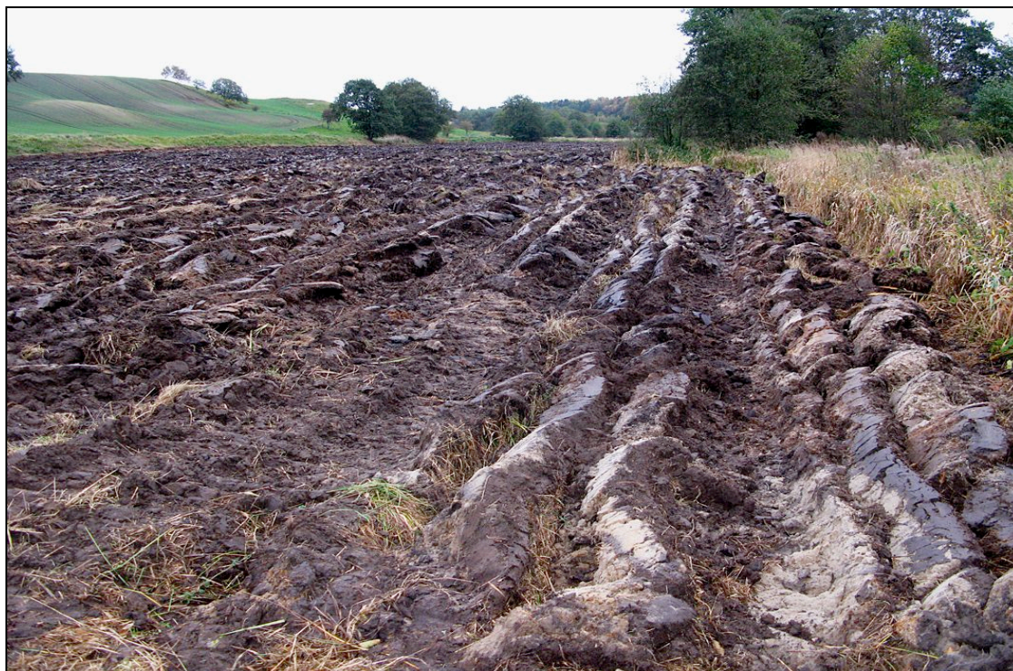
A målsat §3 eng opløjet 2 gange i 2008. Engen har været braklagt.

Der bør gøres opmærksom på, at Naturbeskyttelse.dk har været en del af diskussionen, og der har været argumenteret for, at en ophævelse af brakken ville betyde en nedgang i biodiversiteten. Det skal dog understreges, at alle oplysninger fra Fødevarerhverv indgår i rapporten. Og at der er lagt vægt på at give så retvisende et billede at sagen som muligt. Det var ikke forventet at finde brakmarker placeret på arealer udpeget som §3 natur. Det var forventet at finde arealer med en rig natur, men ikke at de var registreret som beskyttede. Det er specielt overraskende, da myndighederne, landmændene og deres rådgivere har haft gode muligheder for at forhindre dette. Når selv §3 registrerede arealer ikke er beskyttede mod misbrug og landbrugsmæssig udnyttelse, er der grund til at være meget bekymret for de brakarealer, som ikke er §3 registreret. Dette understreger behovet for at gennemgå alle de tidligere braklagte arealer, så tabet af natur kan bremses og for at undersøge konsekvenserne for de opdyrkede arealers omgivelser. Den natur der er registreret på de ubeskyttede brakmarker, har også vist sig at være meget artsrig ofte rummende rødliste arter og arter på habitatdirektivet.