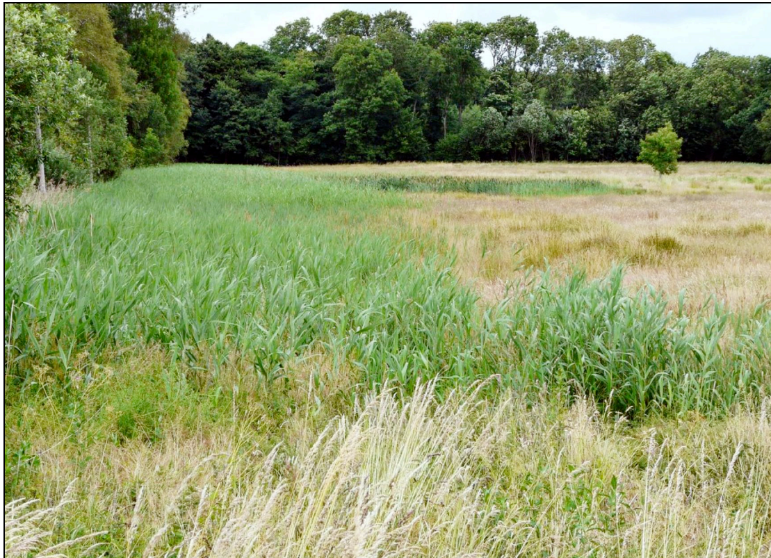
8a. Markblok: 598134-28 Odense kommune

Det kan ikke afgøres, om det er tvungen eller frivillig brak, der er lagt på §3 arealet. Da man ifølge Landbrugsstøttekontoret ikke ved, hvor den frivillige brak er beliggende hos den pågældende ansøger.