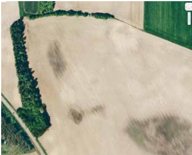
Luftfoto fra 2006 – nu er de små stumper natur helt væk.