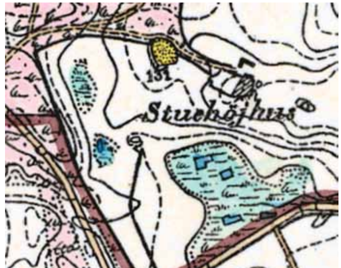
Historisk kort fra samme område i Mariager Fjord kommune. Naturens forsvinden er kun alt for tydelig.

brug, planlægning, jordforurening og grundvand.