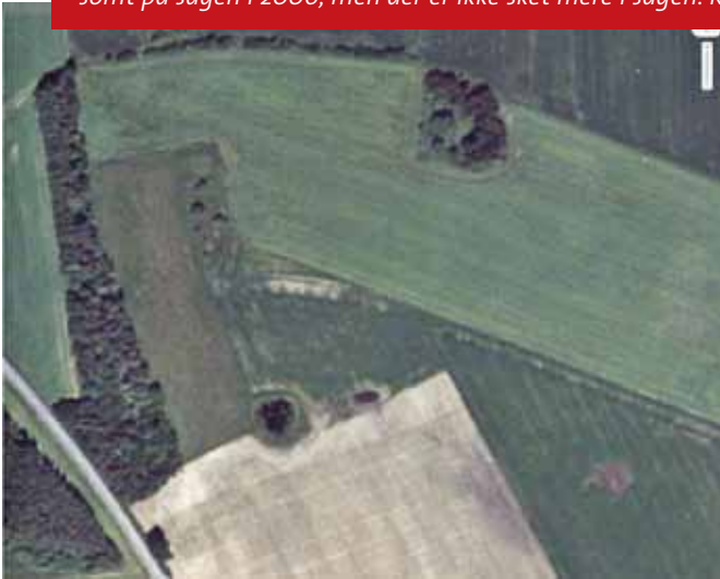
Luftfoto fra 1995. Der er stadig et par vandhuller nederst, et lille stykke mose og et lidt større hjørne natur med træer og buske.

Eksemplet her på siden fra Mariager Fjord kommune viser fjernelsen af naturbeskyttede arealer. Amtet blev opmærksomt på sagen i 2006, men der er ikke sket mere i sagen. Kommunen håber på at få tid til at se nærmere på den i 2009.