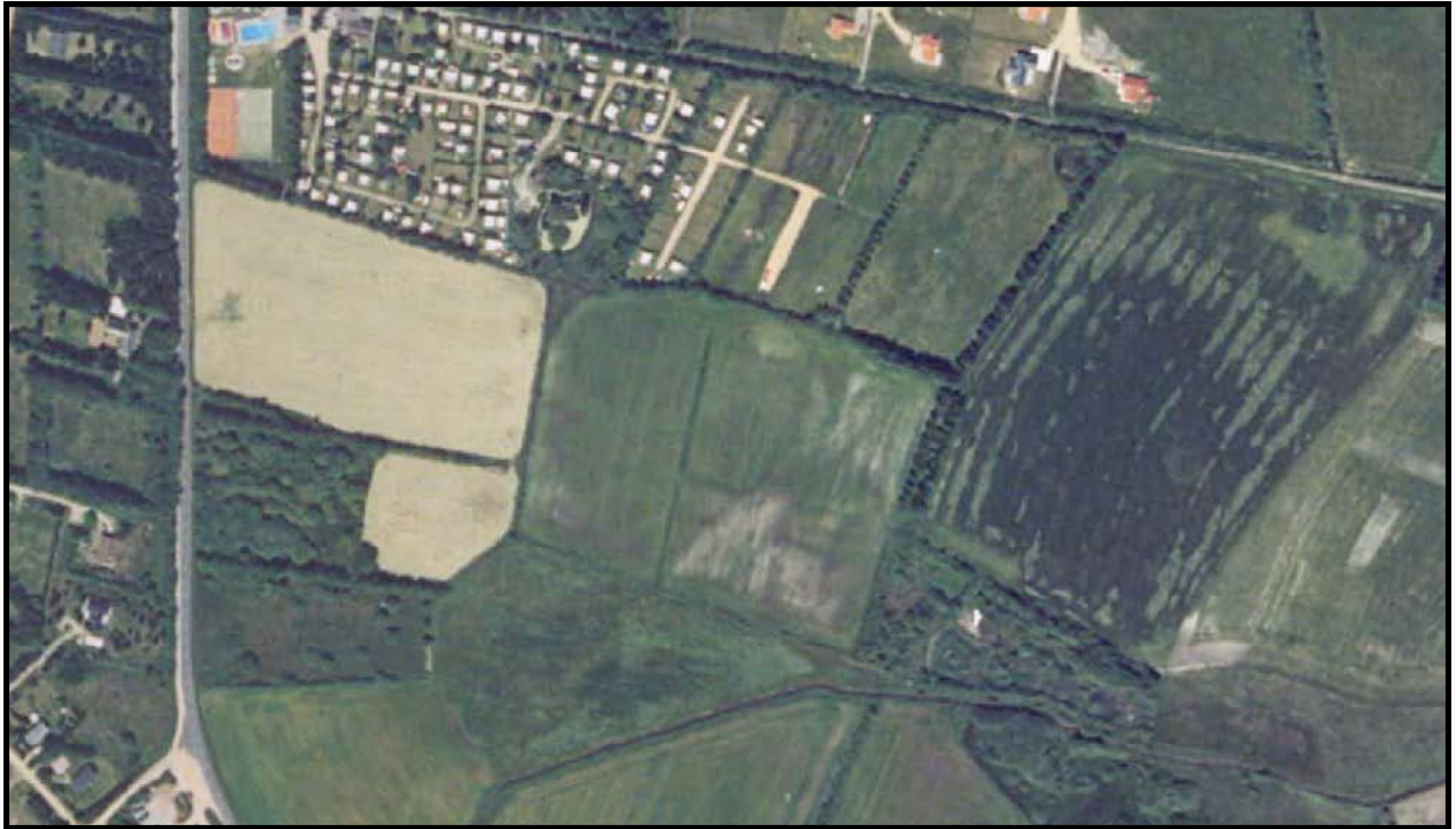
Varde Kommune Matrikel: Houstrup By, Henne 3n