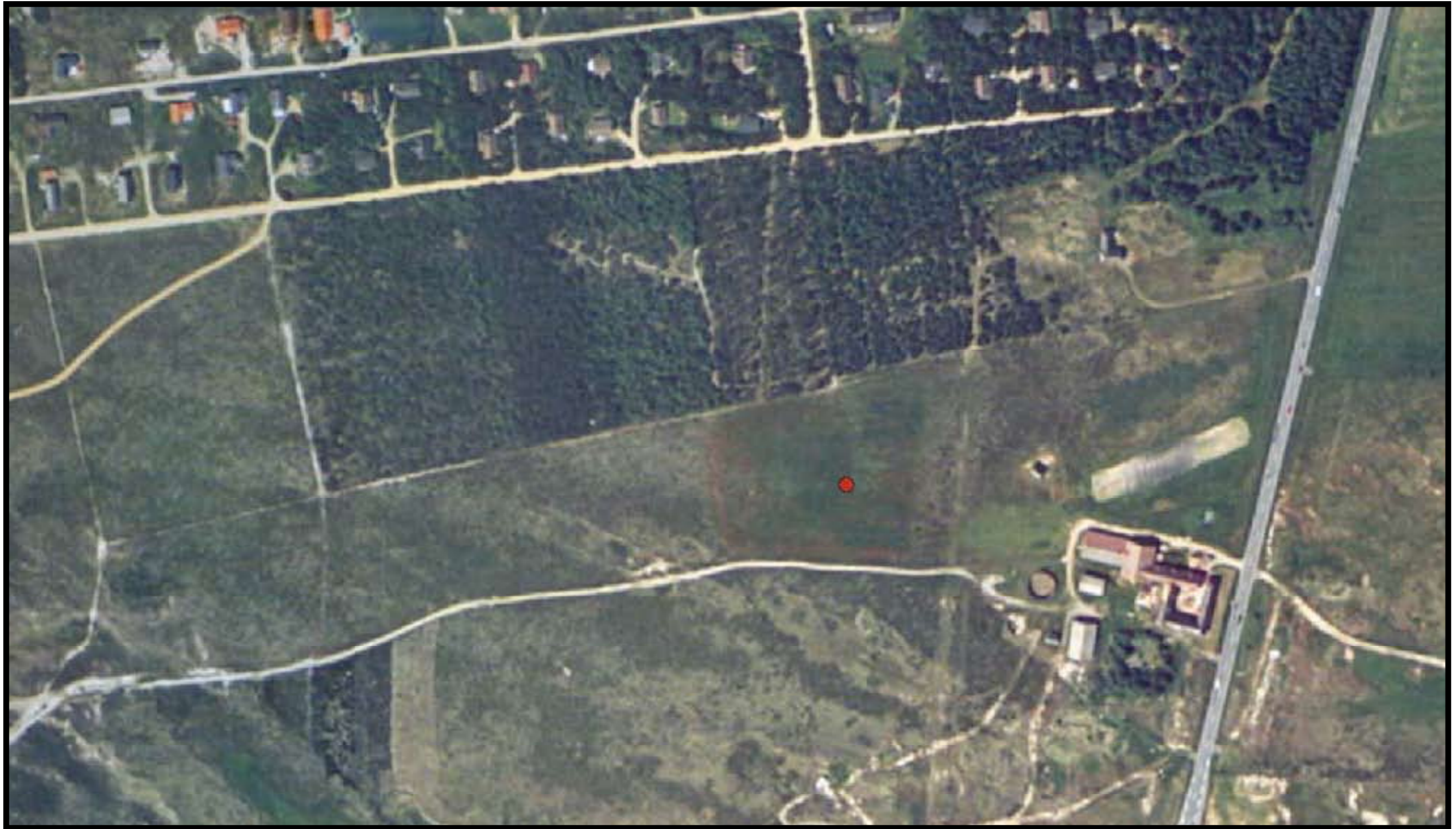
Ringkøbning-skjern kommune Matrikel: Søgård Hgd., Holmsland Klit 156a