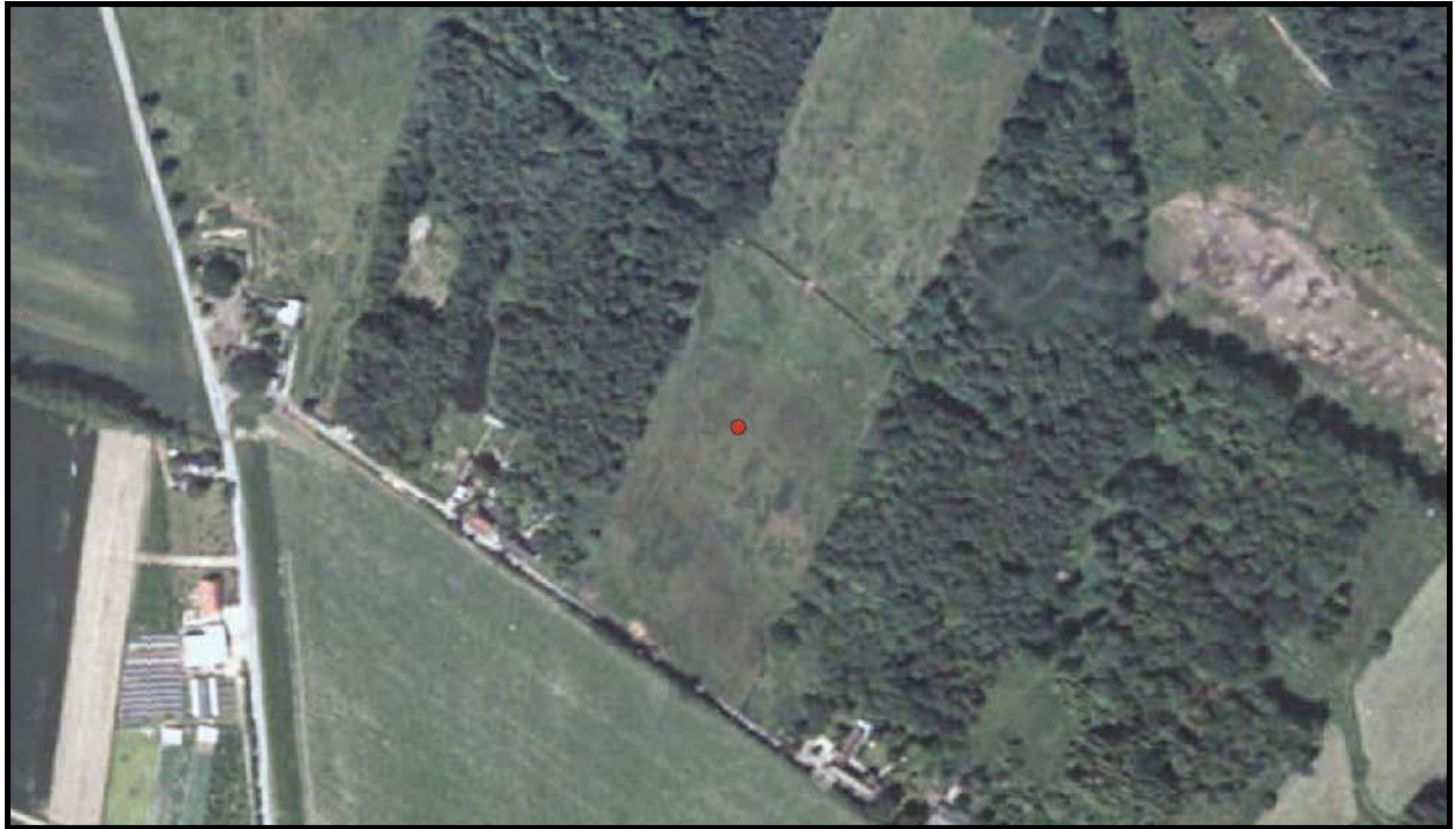
Odense kommune Matrikel: Davinde By, Davinde 31g