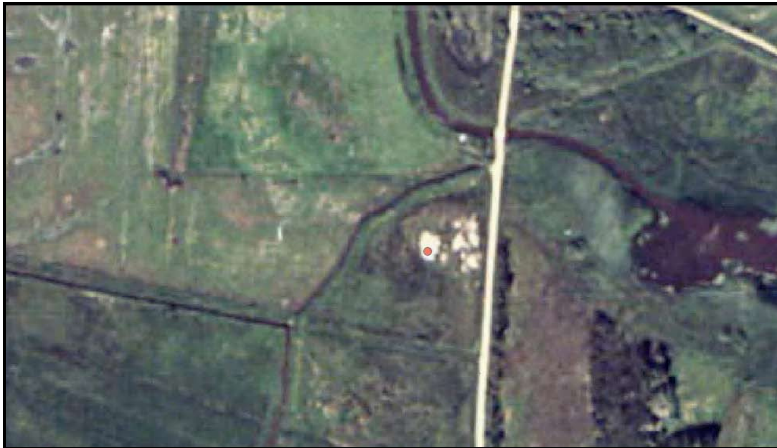
Varde kommune Matrikel: Lønne Præstegård, Lønne 21e