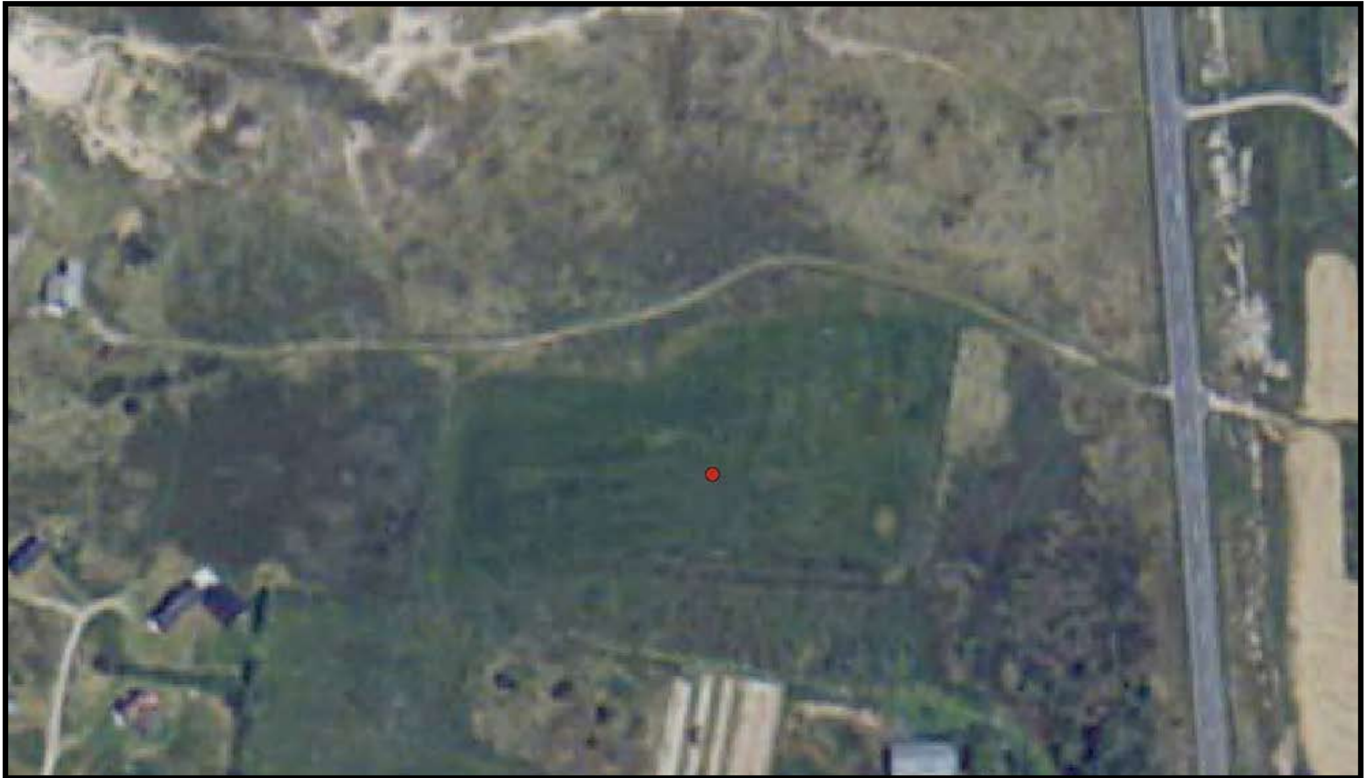
Ringkøbning-Skjern kommune Matrikel: Søgård Hgd., Holmsland Klit 203bæ