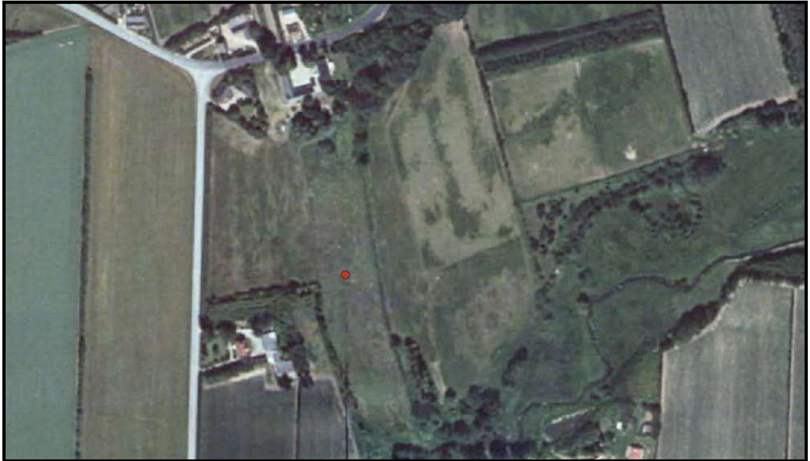
Assens kommune Matrikel: Sarup By, Haarby 2a