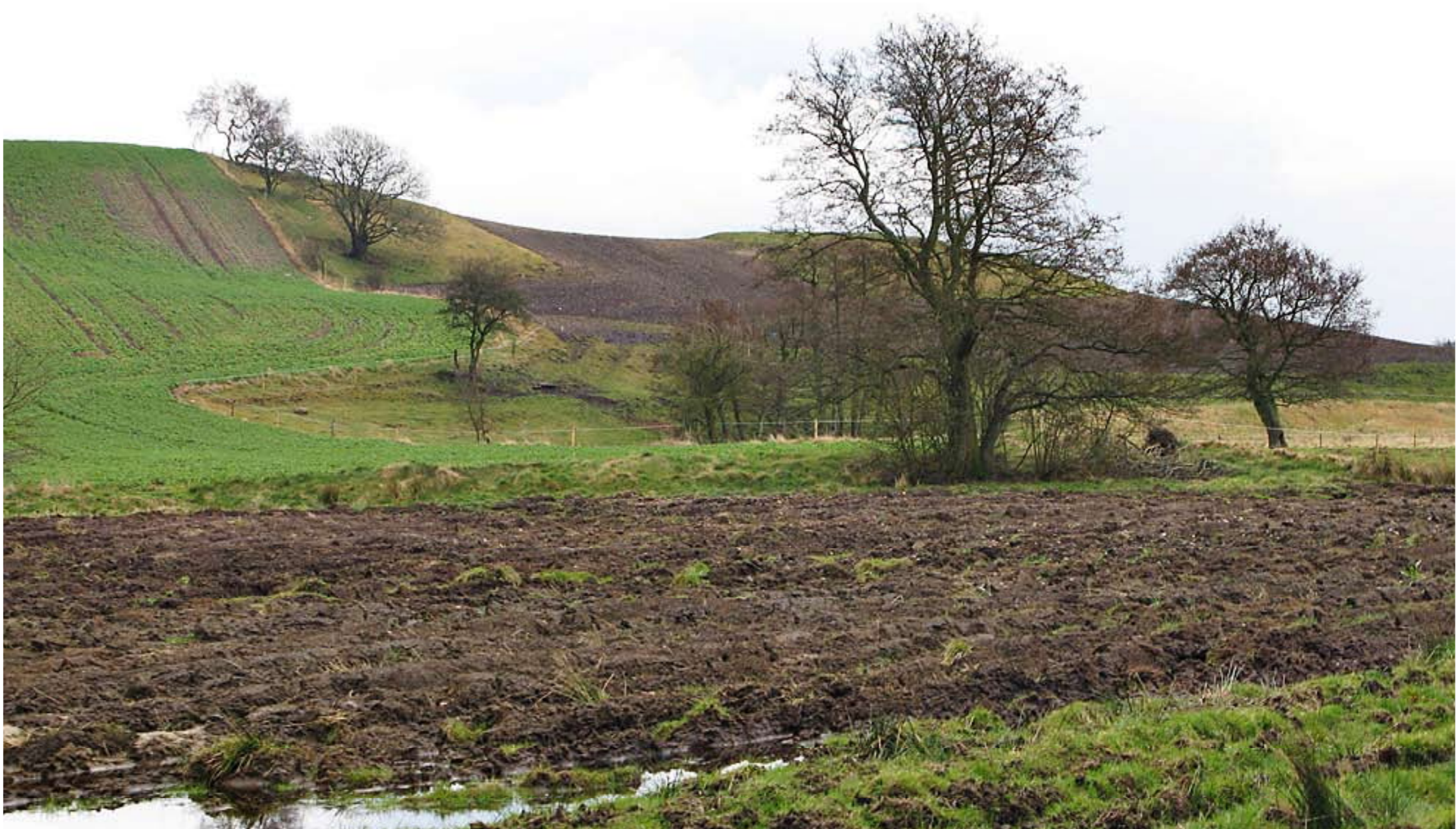
Risikoen for at de beskrevne 11 §3 arealer ender som denne §3 beskyttede eng i Linådalen ved Silkeborg er en alvorlig og reel risiko. Foto: Peder Størup april 2008