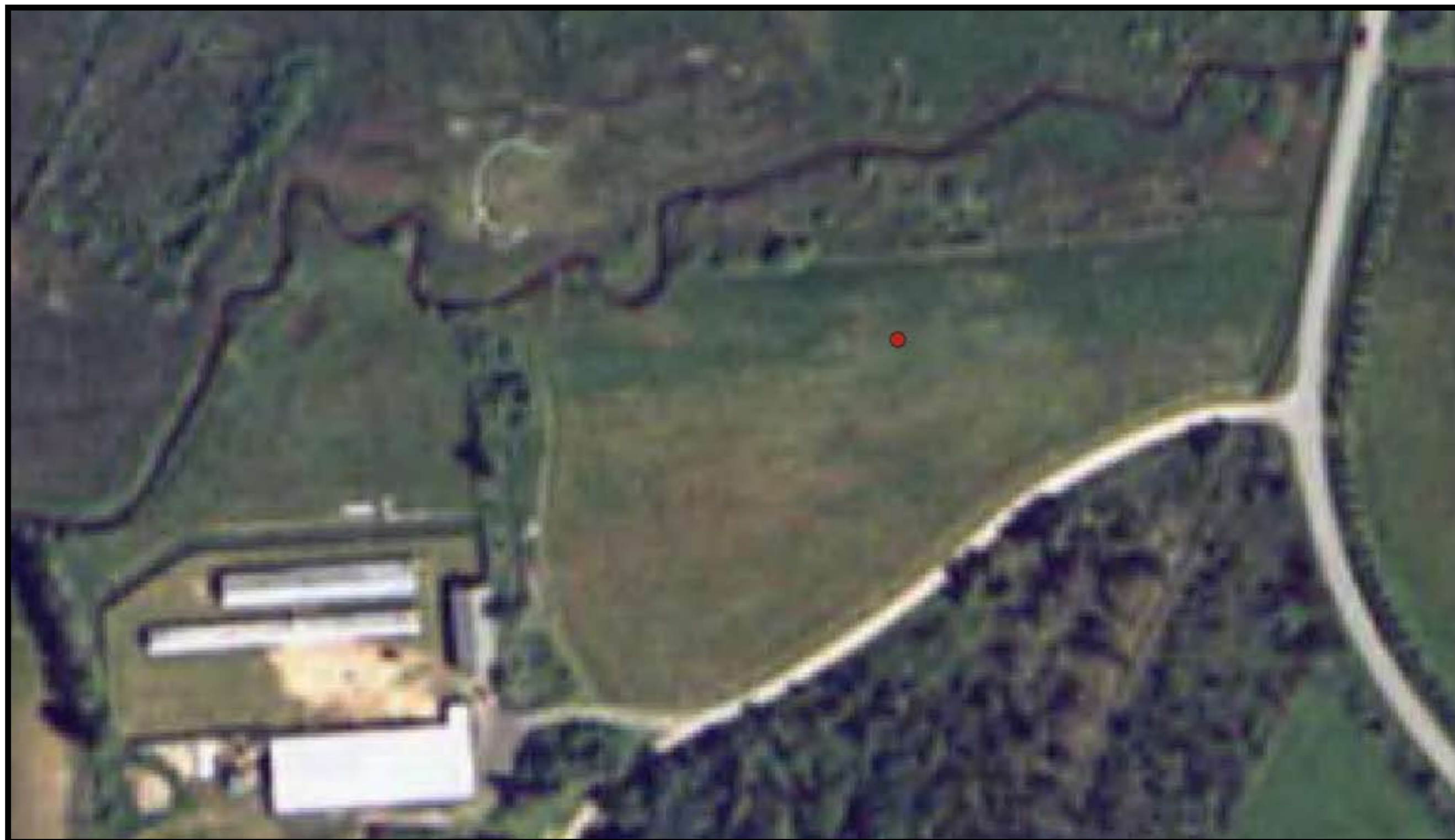
Ringkøbning-Skjern kommune Matrikel: Den nordlige Del, Hee 1d