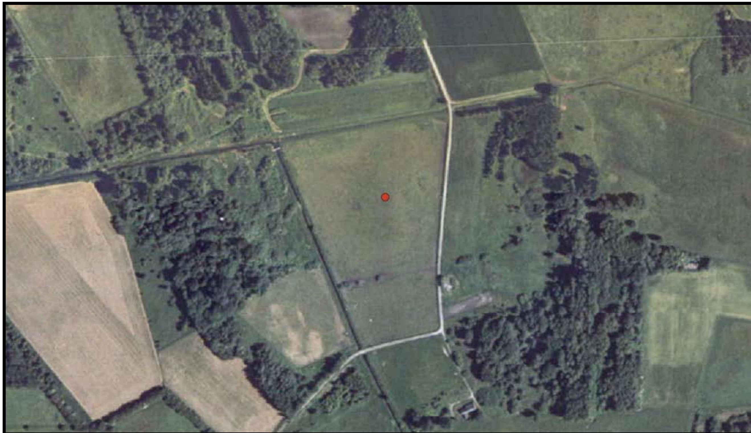
Egedal kommune Matrikel: Hagerup By, Jørlunde 1f