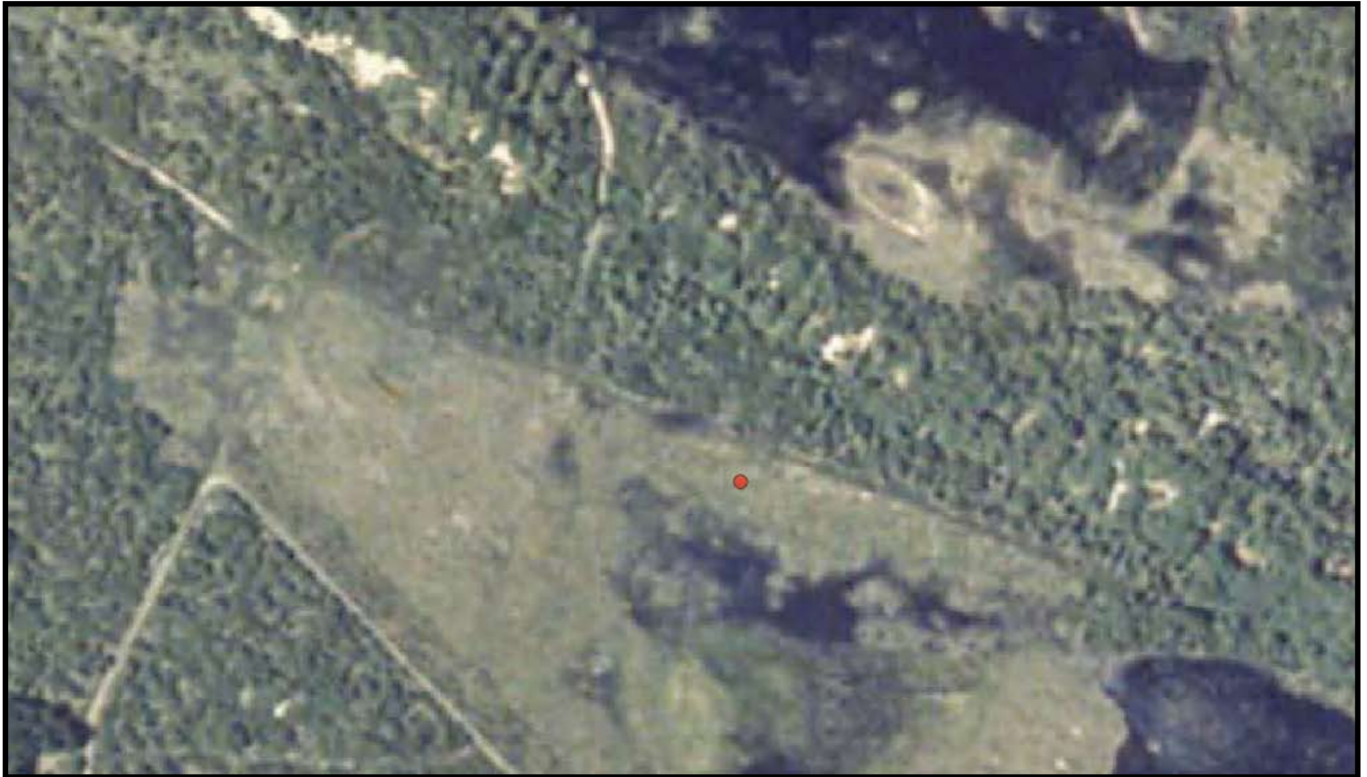
Varde kommune Matrikel: Kærgård, Ål 1h