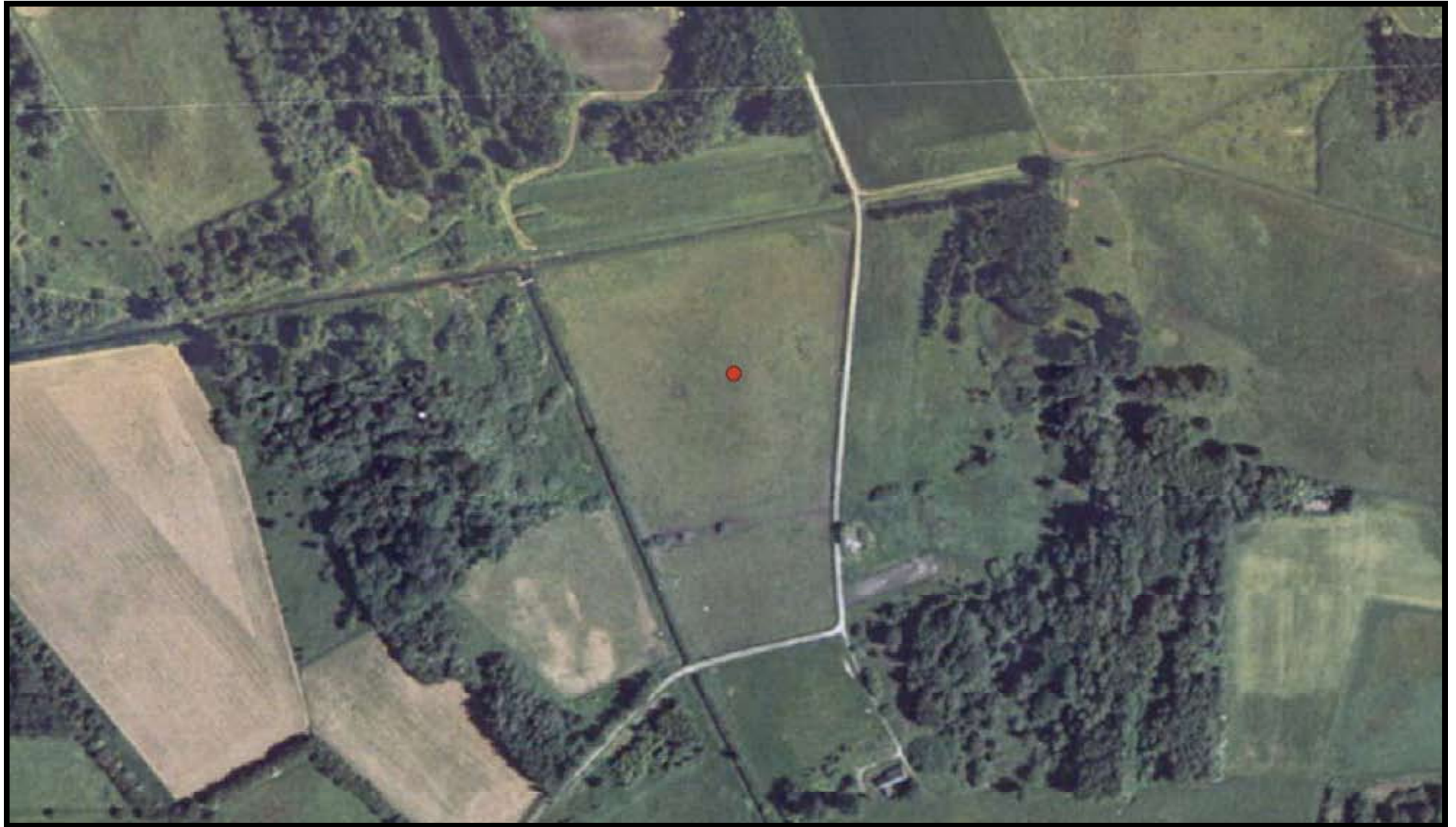
Egedal kommune Matrikel: Hagerup By, Jørlunde 1f