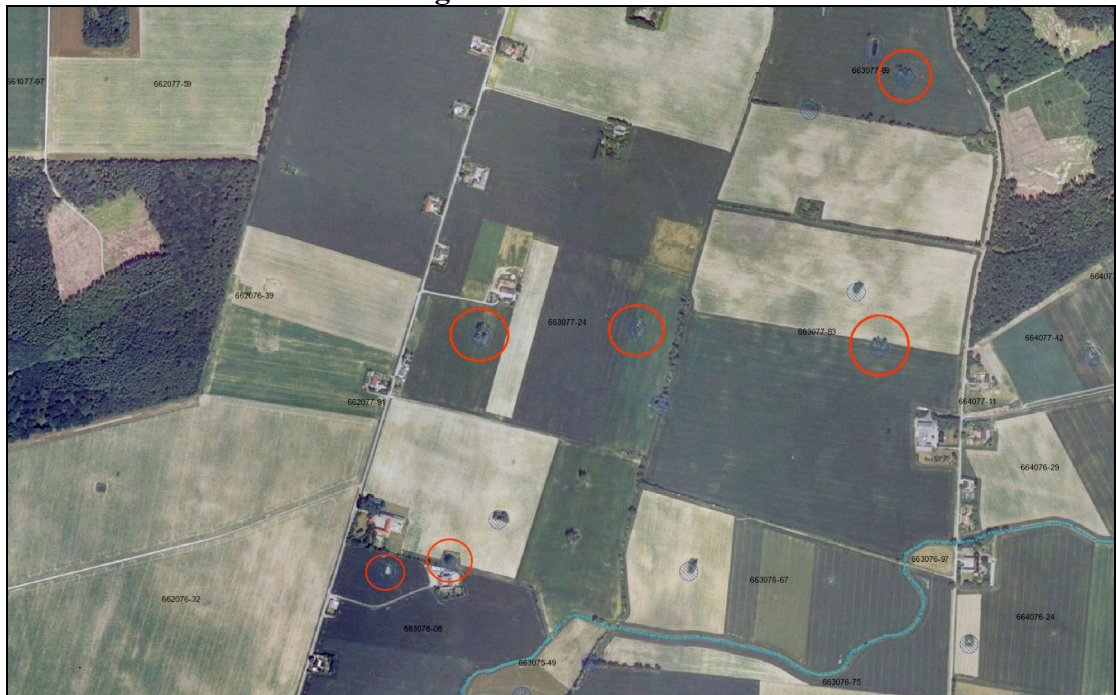
Luftbillede fra 1995 hvor alle søerne stadig eksisterer.