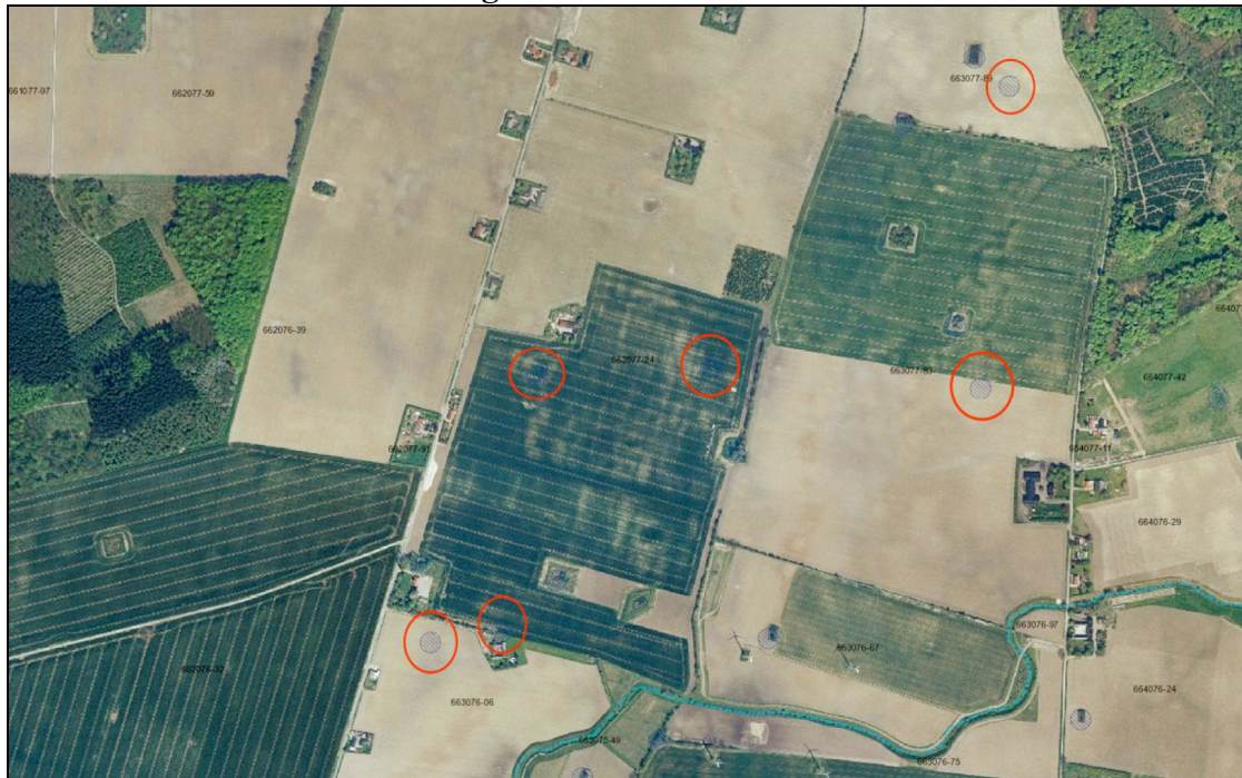
Luftbillede fra 2006 hvor 6 ud af 16 §3 beskyttede søer er forsvundet.