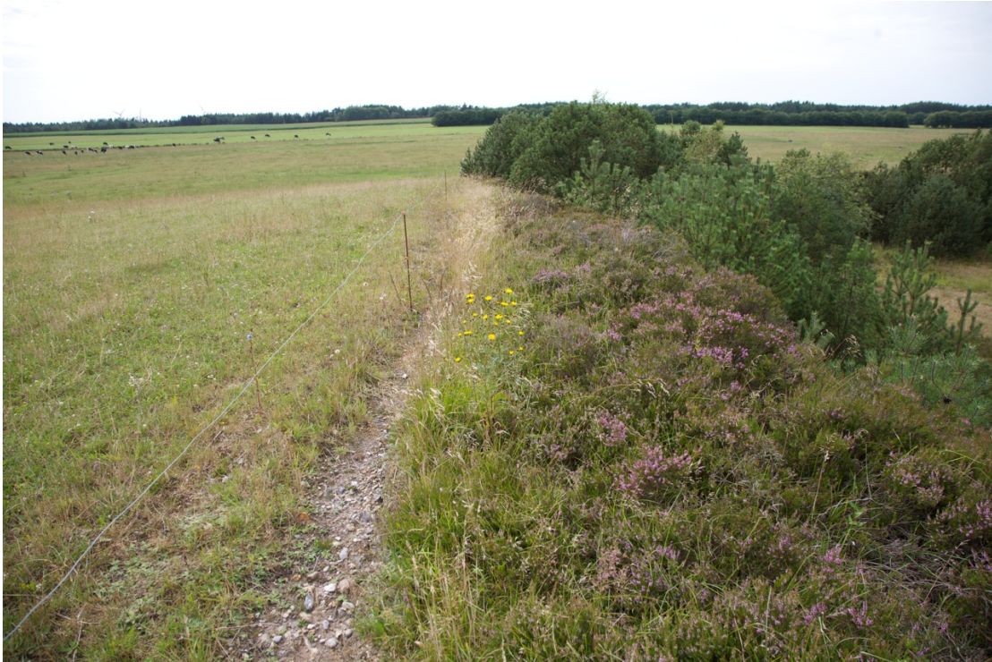
2010 Arealet til højre for heget viser dele som ikke er blevet opdyrket.