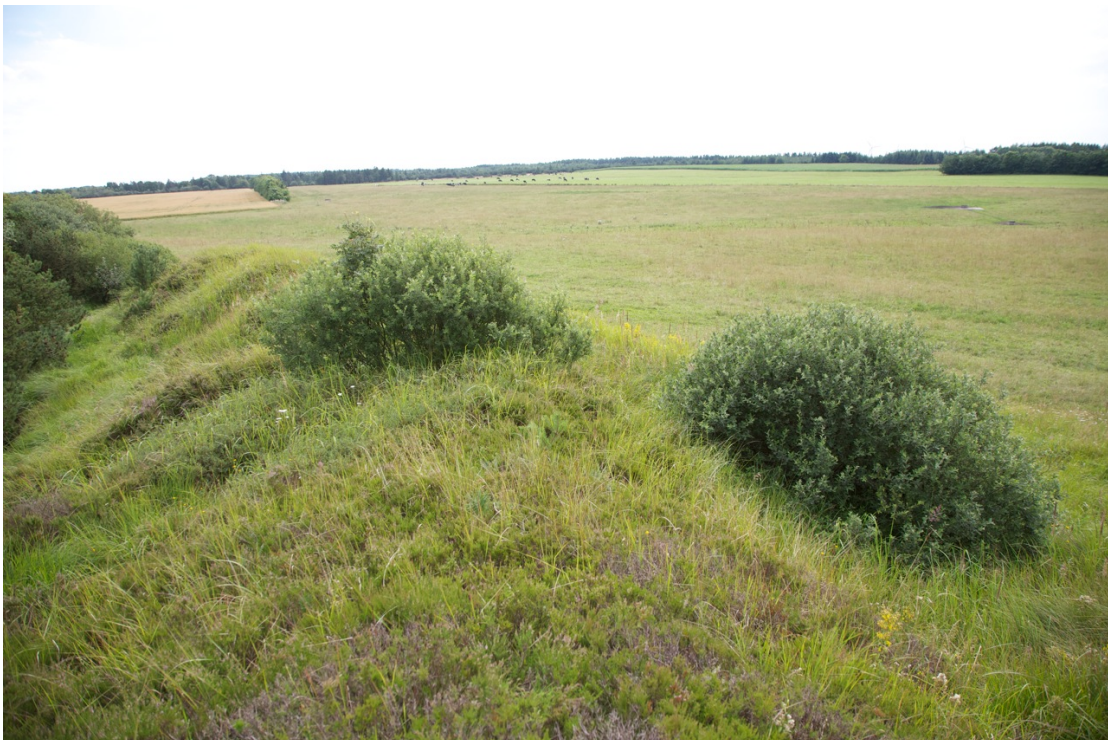
2010 Arealet i forgrunden viser en kuperet del af området, som det ikke har været mulig at intensivere driften på.