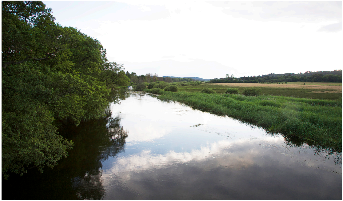
Gudenaån ved Resenbro.