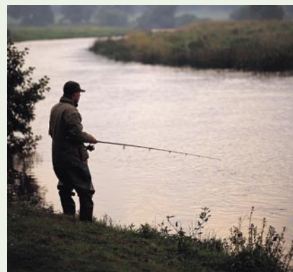
Loven skal sikre og genoprette både vandløb og de enge, de hører sammen med.

Statslige erhvervelser eller ekspropriation kan være den eneste farbare vej for at sikre et naturområde for eftertiden, sikre naturgenopretning eller sikre en god adgang for offentligheden. Derfor skal loven sikre, at der afsættes en tilpas beløbsramme på den årlige finanslov til disse formål.